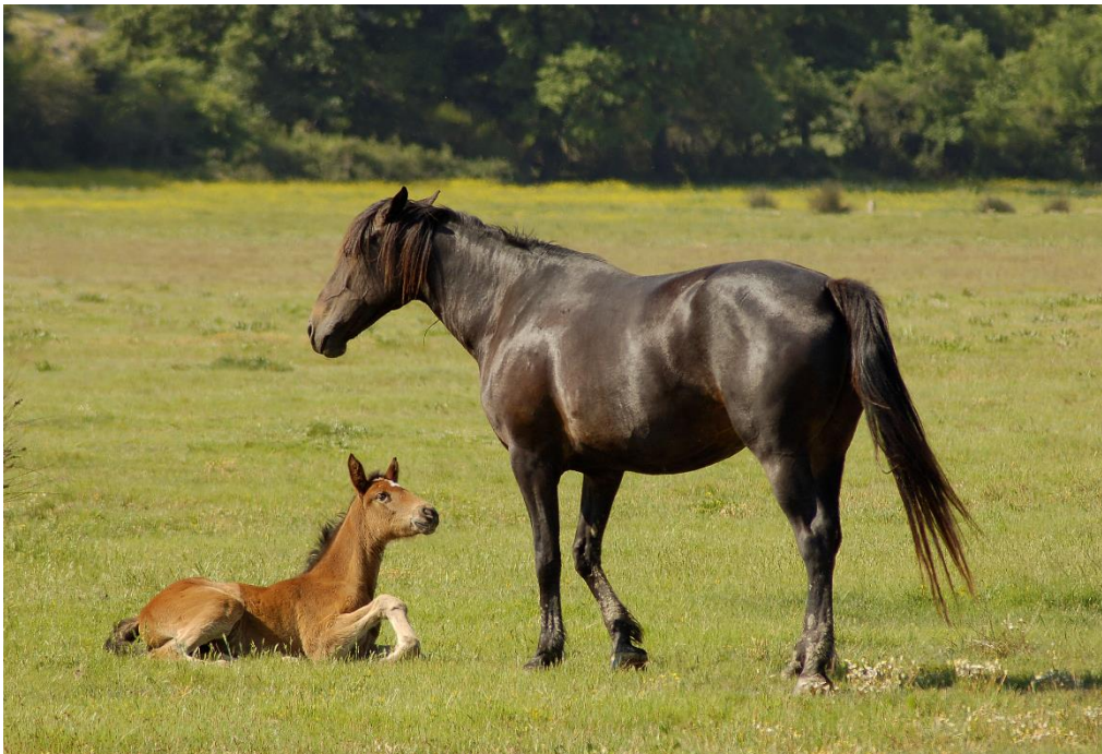
Foto: fattrice razza equina maremmana con redo – Tenuta di Alberese

Ente Terre gestisce il parco stalloni regionale e ne coordina l'attività, compreso l'allevamento degli equidi di proprietà della Regione Toscana, la cui consistenza è scesa a 41 capi (7 equini maschio, 17 asini maschio e 17 asine femmina). Il patrimonio degli equidi di proprietà della Regione Toscana è costituito dalle razze autoctone toscane: Asino dell'Amiata, Maremmano, Appenninico e Cavallino di Monterufoli, ma è attualmente costituito, se si eccettua la razza Appenninica, da cavalli ormai di età avanzata e per la maggiorparte non più produttivi, in termine di seme. La consistenza dell'Asino dell'Amiata è cresciuta negli anni e si rileva anche la presenza di un patrimonio di fattrici (le femmine di proprietà sono tutte appartenente alla specie asinina) che per il 55% ha un'età inferiore ai 10 anni.