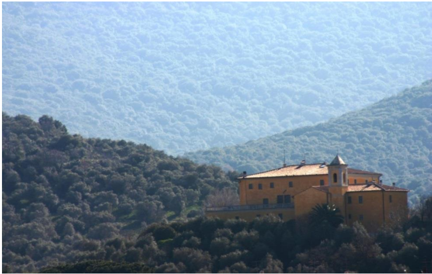
Foto – Villa Fattoria Granducale – Tenuta di Alberese – struttura agrituristica

Di seguito una tabella sintetica che riporta altri elementi che caratterizzano l'ospitalità della Tenuta di Alberese.