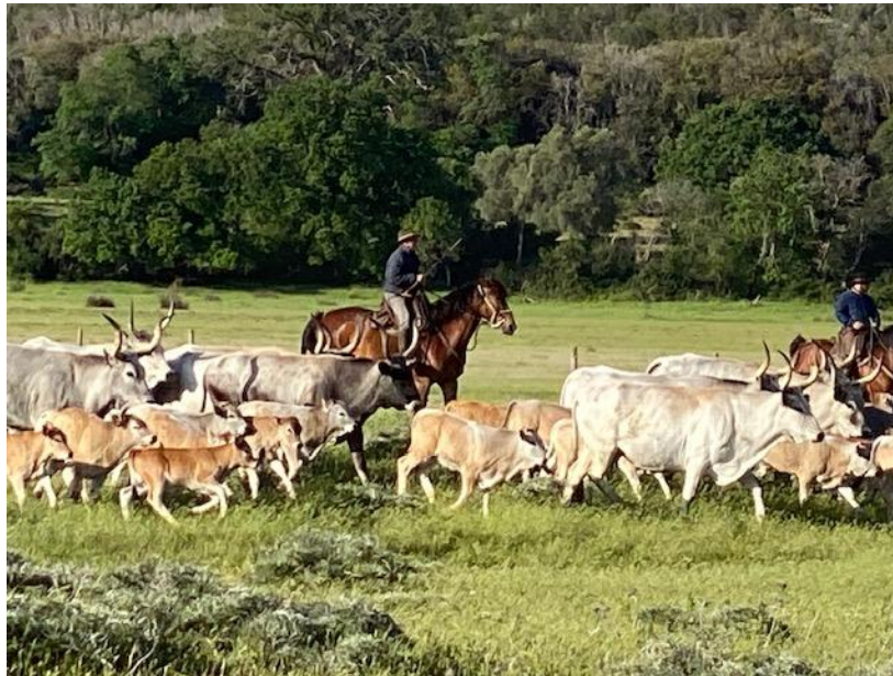
Buttero della Tenuta di Alberese che governa a cavallo mandria di bovini maremmani

È utile evidenziare che l'attività di valorizzazione del Bovino maremmano avviene di concerto con ANABIC che ha scelto la tenuta di Alberese come centro di selezione genetica per i riproduttori maschi della razza. L'attività zootecnica nelle sue modalità tradizionali di gestione mantiene vivo e necessario il lavoro dei butteri ma anche una parte legata alla produzione degli alimenti (foraggi e granaglie) per l'alimentazione delle centinaia di animali allevati.